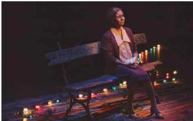
La plaza del diamante

El director, l'actor, l'actriu són, primer que res, intèrprets en el sentit més ampli del mot. És a dir, espectadors privilegiats de l'obra i, doncs, primers lectors d'alguns dels seus sentits, demiürgs també. En algunes propostes, fins i tot s'hi sumen els ecos de la pròpia trajectòria, la memòria de papers anteriors, com si seguíssim la línia de punts que acaba per completar una figura. L'operació no és innocent. En una posada en escena, tot compta. I un intèrpret teatral amb personalitat –real o inventada, aquesta és la gràcia, com sabia Hollywood– perfuma els personatges que se li encarreguen. Si, a més, el director ho salpebra amb una mirada personal, el que passi a l'escenari acaba per sumar molt més que la mera suma dels seus components.