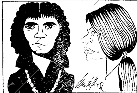
Juan Ribó y Maribel Martín

Producción española (1974). Director, Francisco Rovira Beleta. Principales intérpretes, Maribel Martín, Juan Ribó, José María Rodero, Carlos Ballesteros y José Bódalo. En color. Cines, Chaplin I y Rialto.