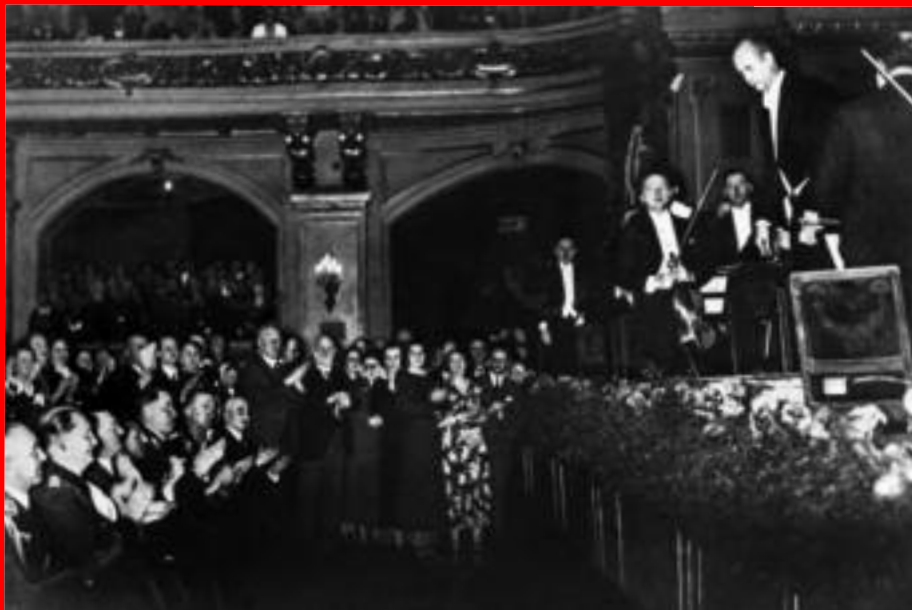
"Wilhelm Furtwängler saludant al final d'un concert de l' Orquestra Filharmònica de Berlín. Asseguts, a primera fila, es pot veure a Hitler i Goebbels junt amb altres alts càrrecs nazis".

Berlín, 1946, una ciutat destruïda com a conseqüència de la guerra. Destrucció, desorientació, mort; la fi d'una etapa. Assistim als prolegòmens i investigacions preparatòries per al judici que durà a terme la Comissió Anti-nazi per als Artistes. El major Steve Arnold, a la seva vida civil inspector d'assegurances, rep l'encàrrec d'investigar les implicacions del director d'orquestra Wilhelm Furtwängler acusat de col·laboracionisme amb el règim nazi durant la II Guerra Mundial.