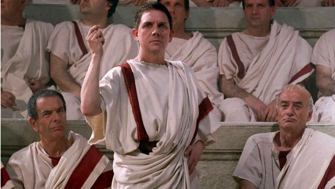
David Bamber fue el actor que dio vida a Cicerón en la serie 'Roma'.

Novelas, sí. El inglés Robert Harris , autor de bestsellers de calidad, tiene una contundente trilogía sobre Cicerón —y sus luces y sombras, que se dice—, editada en España por Grijalbo: Imperium (2006), Conspiración (2009) y Dictator (2015). Edhasa publicó hace años una asequible biografía de otro británico, Anthony Everitt . Todas las principales obras de Cicerón —las ya dichas, Discursos , Tusculanas , Sobre la vejez , Sobre la amistad... — están traducidas y reeditadas, algunas varias veces, al español.