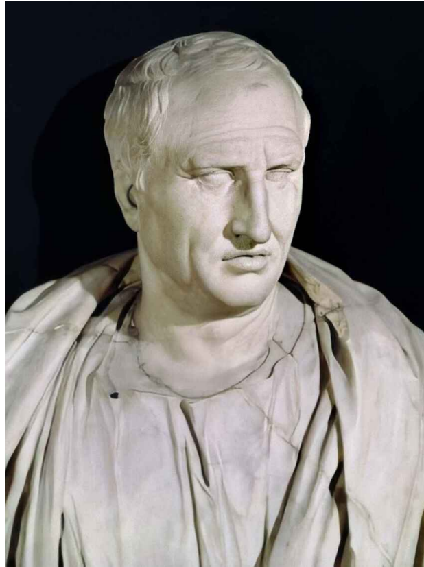
Busto de Cicerón conservado en los Museos Capitolinos.

de intervenir en los problemas del presente. En Viejo amigo Cicerón se tratan muchos temas de envidia, pero brilla la idea de que el respeto a la ley y a la representación política es el pilar de la democracia.