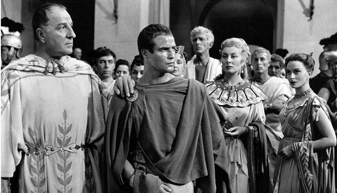
Fotograma de la película 'Julio César' (1953)

romanos siempre salen con flequillo —salvo los calvos— en las películas y por qué será que, en ésta en concreto, todos sudan mucho y todo el rato menos la inminente víctima.