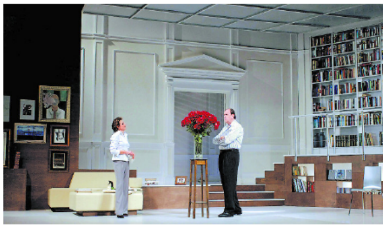
La obra La cabra o qui és Sylvia? , de Edward Albee, en el Teatro ROMEA de Barcelona.